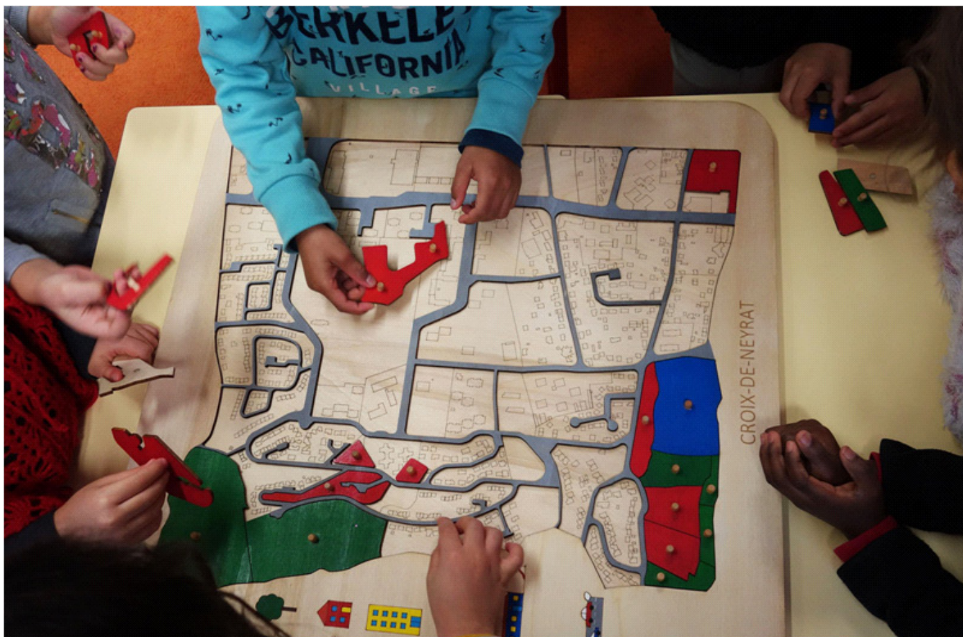
Résidence 2017 / 2018 – Pop'up Croix de Neyrat – Charlotte Boyard