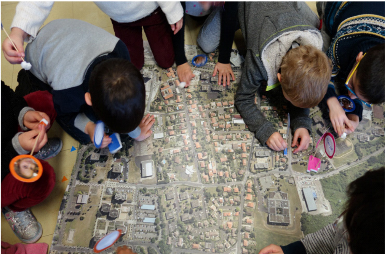
Résidence 2017 / 2018 – J'explore mon quartier – B.Gillet / M.Valencia