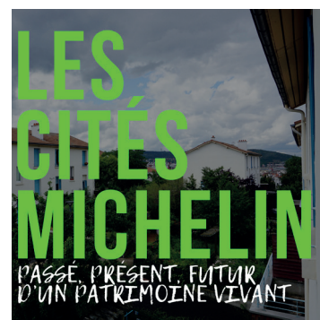
TABLE RONDE N°2 « MURAILLE DE CHINE – SAINT-JACQUES CLERMONT-FERRAND » → MARDI 14 NOVEMBRE – 18H EN GRAND AMPHI

Le premier épisode, « Transplantation », est à découvrir le 9 novembre !