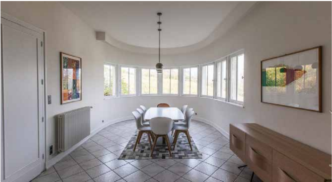
La Villa Sabourin

Comme vu précédemment, l'architecte ou le paysagiste peut proposer un binôme, en ayant connaissance et conscience des conditions proposées et des contraintes.